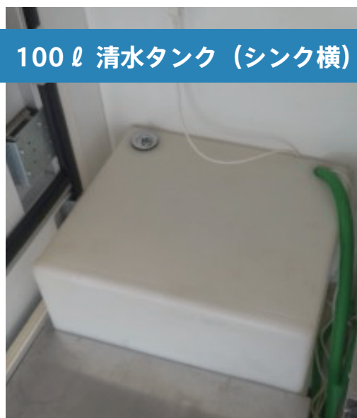
100ℓ 清水タンク (シンク横)